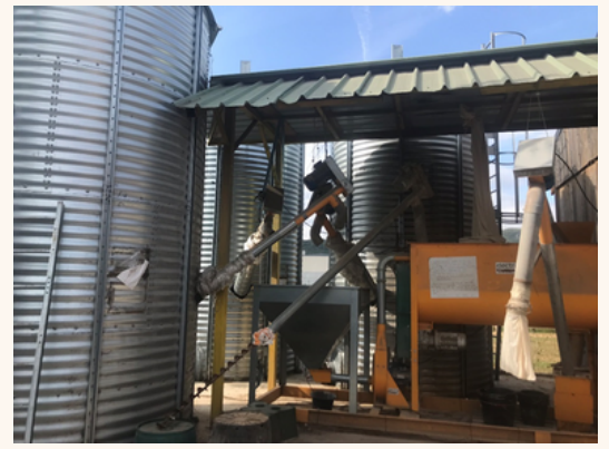
Les silos pour le stockage du grain du collectif

Le GIE ( Groupement d'Intérêt Economique) EPI de BLE existe depuis 2017 et rassemble des éleveur.se.s de volailles ainsi qu'un lycée agricole (éleveur et céréalier) autour d'une fabrique collective d'aliment. L'objectif est d'acheter les matières premières de l'aliment pour volailles en direct des producteurs, le plus localement possible et à un prix juste pour les céréaliers comme pour les éleveurs.