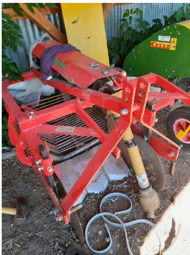
arracheuse à pdt