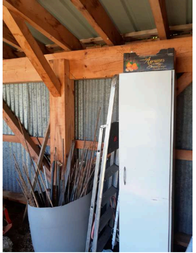
méthode Lindt: 1 careaux de chocolat à chaque outil rangé !