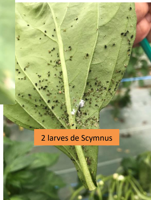
2 larves de Scymnus