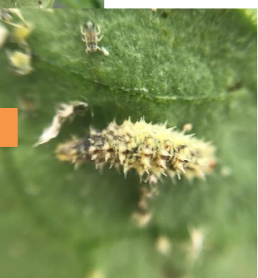
Larve de syrphes