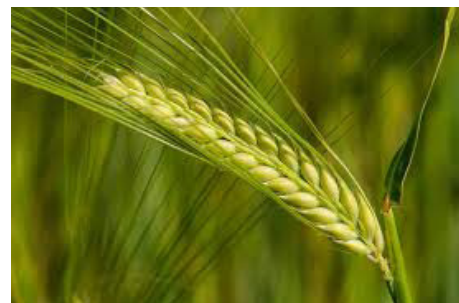
▲ Epi d'orge