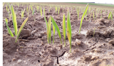
▼ Levée d'orge (J.Laurent)